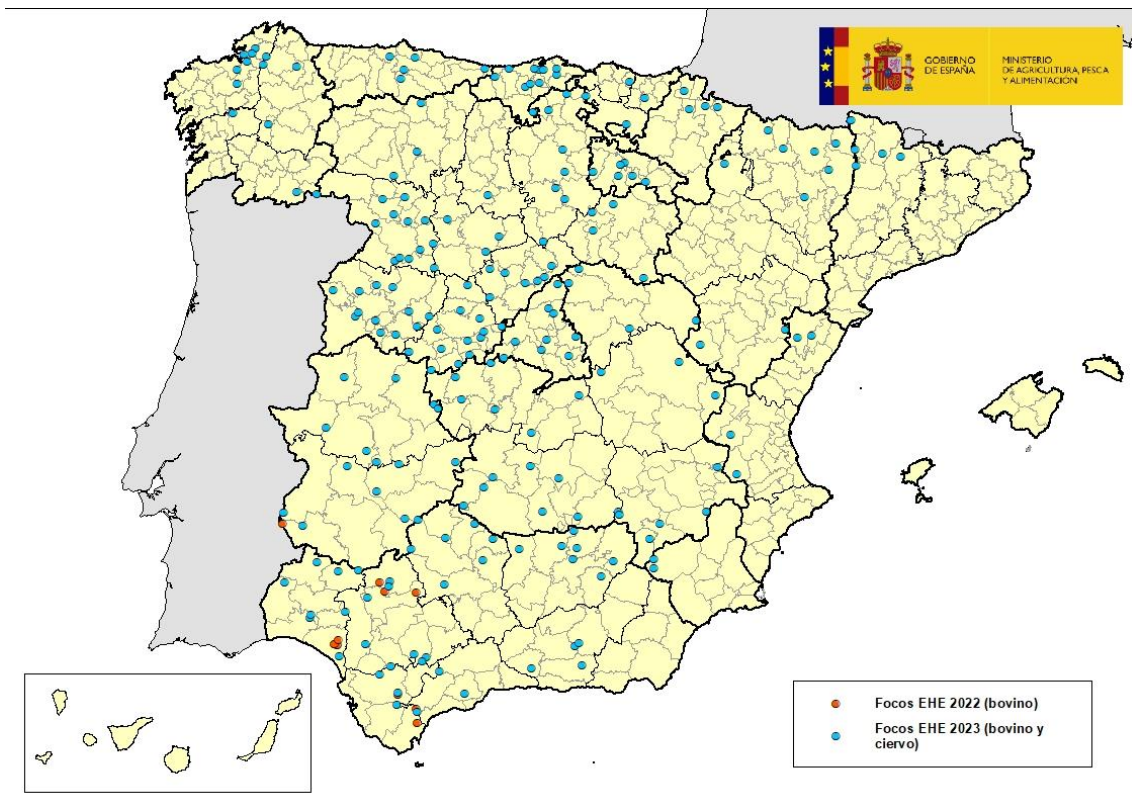
Mapa 1: Comarcas afectadas por EHE en España en años 2022 y 2023

Desde la última actualización sobre la enfermedad realizada el pasado 18 de octubre, el Laboratorio Central de Veterinaria (LCV) de Algete, laboratorio nacional de referencia para esta enfermedad, ha confirmado casos de enfermedad hemorrágica epizootica (EHE) en 20 nuevas comarcas. De ellos, 19 se han detectado en explotaciones de bovino en las comarcas de: Santesteban (Navarra); Alt Urgell (Seu d'Urgell, Lleida); Santo Domingo de la Calzada (La Rioja); Deza (Pontevedra); Chantada, Terra Cha Castro y Terra Cha Guitiriz (Lugo); A Gudiña (Ourense); Barbastro (Huesca); San Vicente de la Barquera (Cantabria); Briviesca, Espinosa de los Monteros, Lerma, Burgos y Villarcayo (Burgos); La Pola de Gordón y La Bañeza (León); Palencia (Palencia) y Soria (Soria). Asimismo, se ha detectado 1 caso en ciervo en la comarca de Sequeros (provincia de Salamanca). Ver mapa 1.