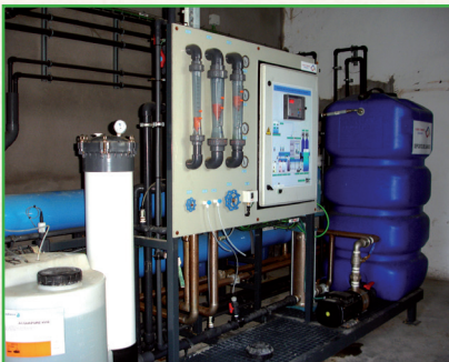
Planta de tratamiento de agua