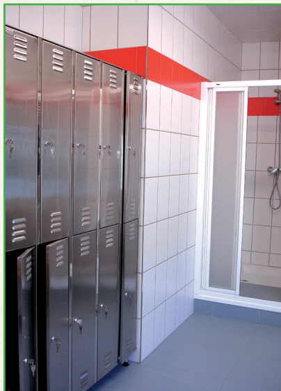
Taquillas y duchas