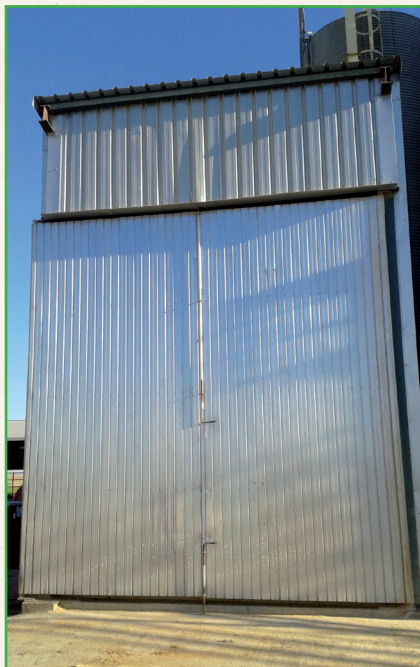
Detalle de puerta de cierre de piqueta de recepción de alimento