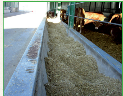
Comedores fáciles de limpiar