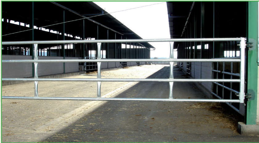
Detalle de la manga de manejo polivalente