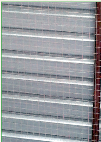
Malla en techo para evitar la entrada de palomas