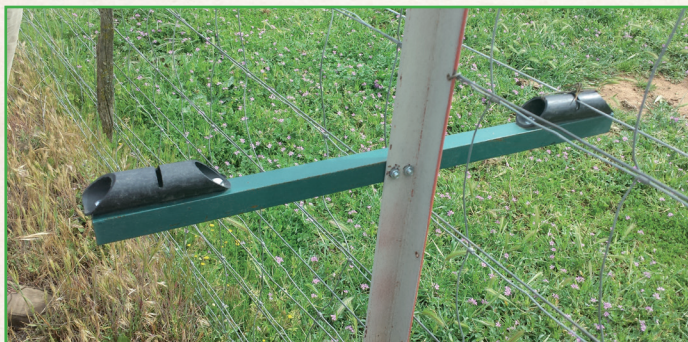
Vallado con pastor eléctrico

Se recomienda una evaluación profesional previa y el diseño de un plan personalizado a las especiales circunstancias de la ganadería