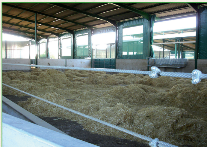
Corral en cuarentena listo para la recepción de animales