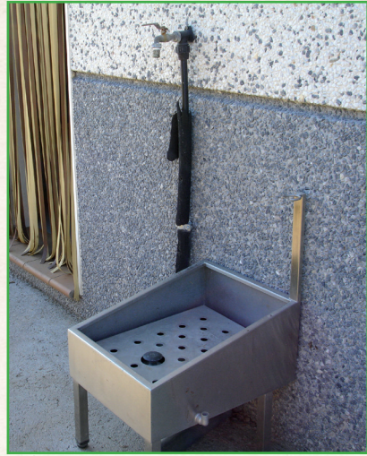
Lavado de botas