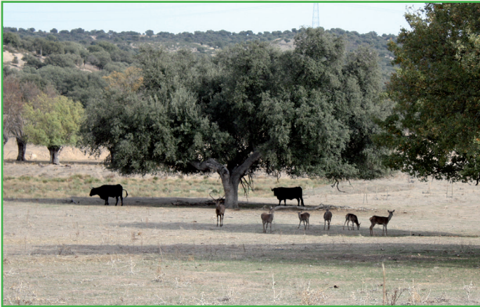
Contacto entre fauna silvestre y ganado